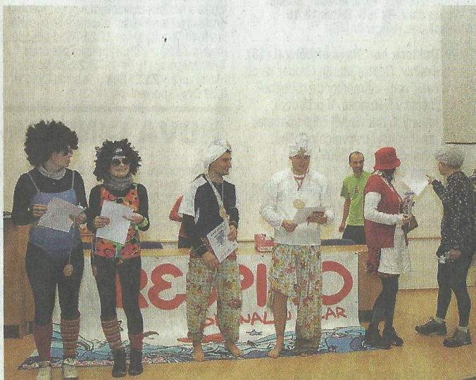
OCENĚNÍ v kategorii Podivíni dostávají zasloužené medaile.

Na sedmáct kontrolních stanic byl omdesátiminuto-