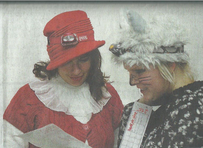
KARKULKA s vlkem pročítají mapu a chystají taktiku.

Výsledky: Ženy: 1. Kvapem Šubrtáme, 2. Chicas, 3. Los Koblihatos. Muži: 1. VM, 2. Pomalí kluci, 3. Orientální běžci. Smíšení: 1. Lampióni, 2. Born to Harcovskhi Bhloudil, 3. TURci.