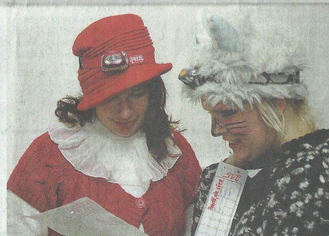
KARKULKA s vlkem pročítají mapu a chystají taktiku.